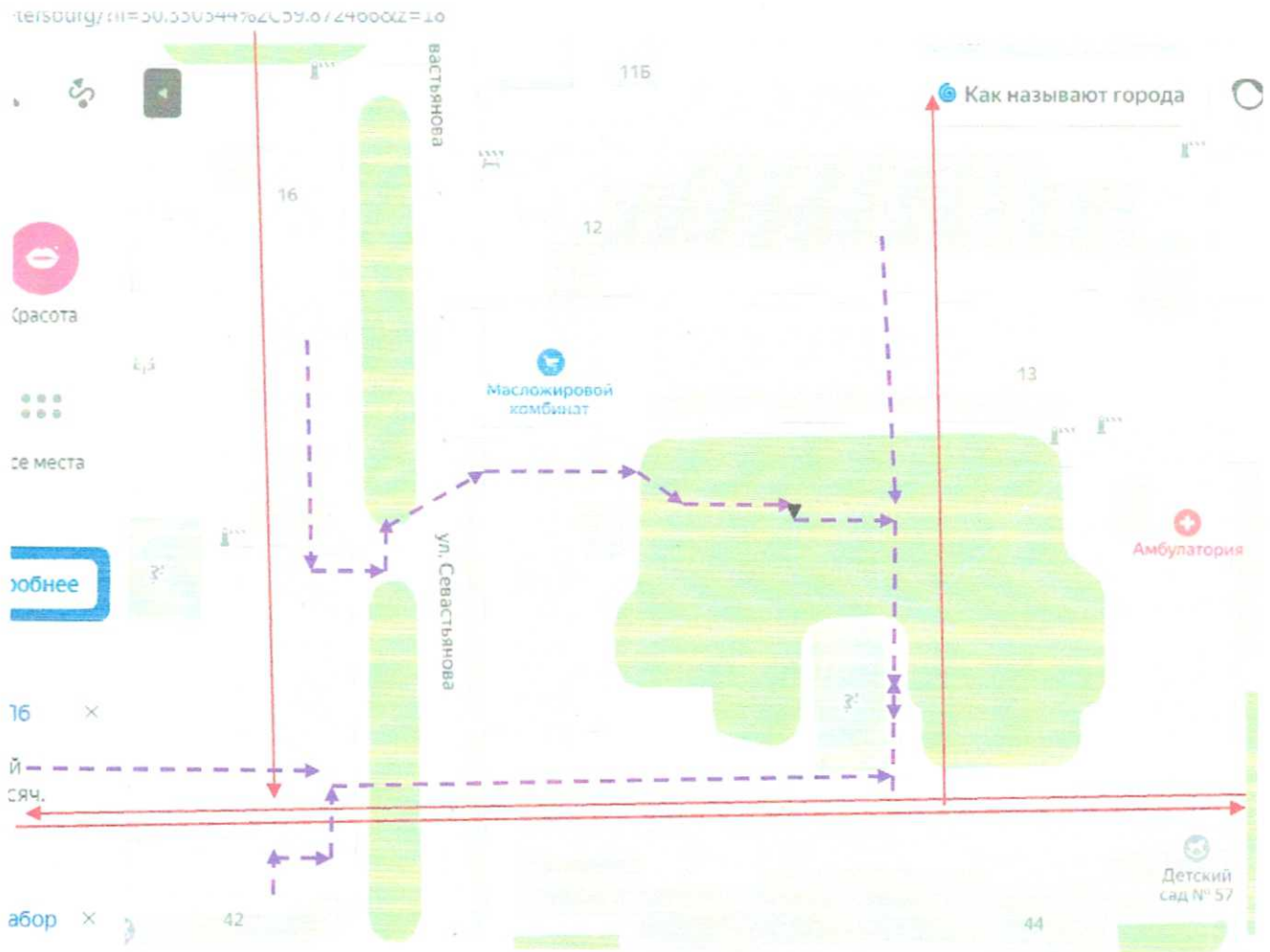
Схема организации дорожного движения в непосредственной близости от образовательного учреждения с размещением соответствующих технических средств, маршруты движения детей и расположение парковочных мест