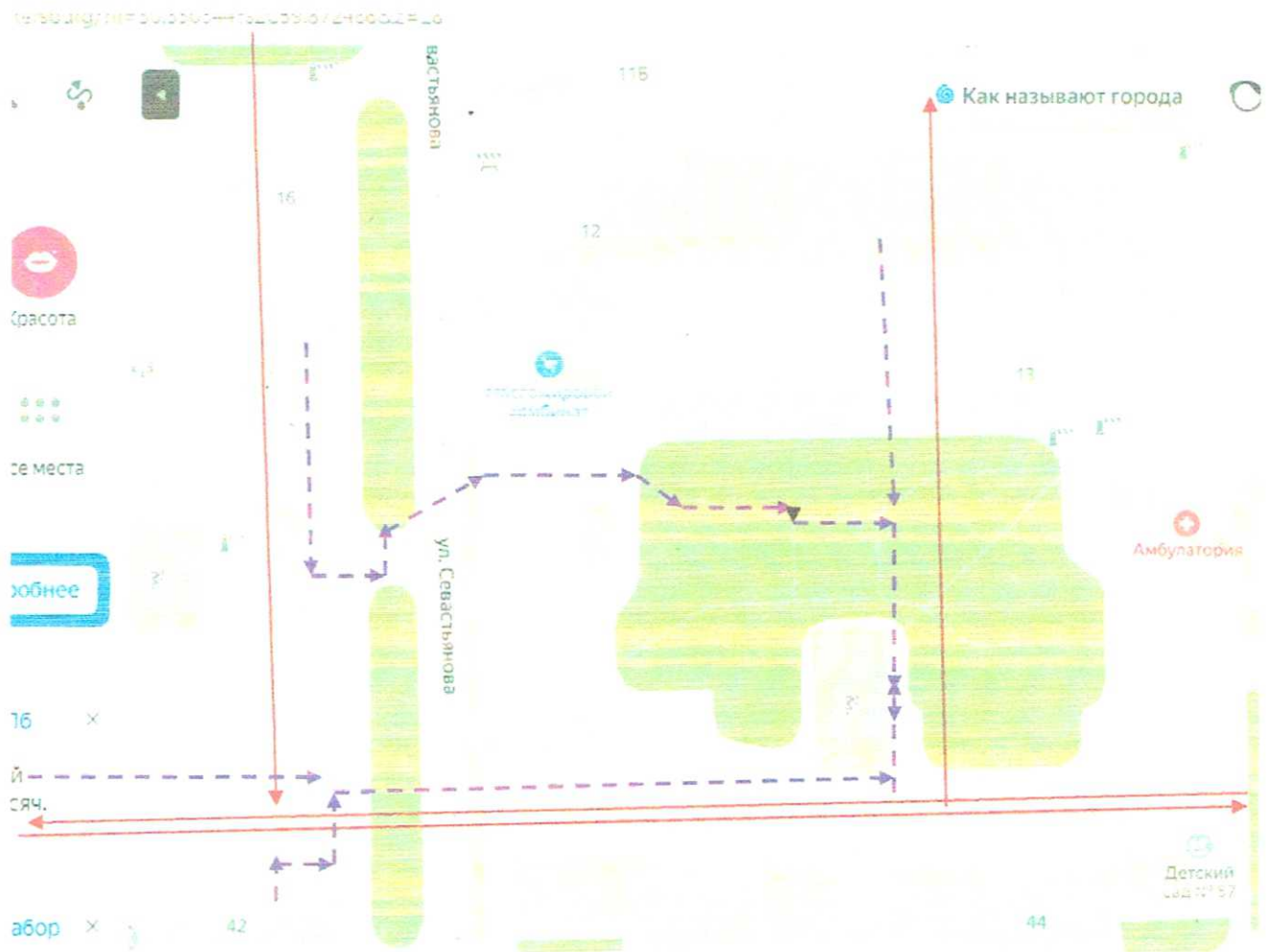
Схема организации дорожного движения в непосредственной близости от образовательного учреждения с размещением соответствующих технических средств, маршруты движения детей и расположение парковочных мест