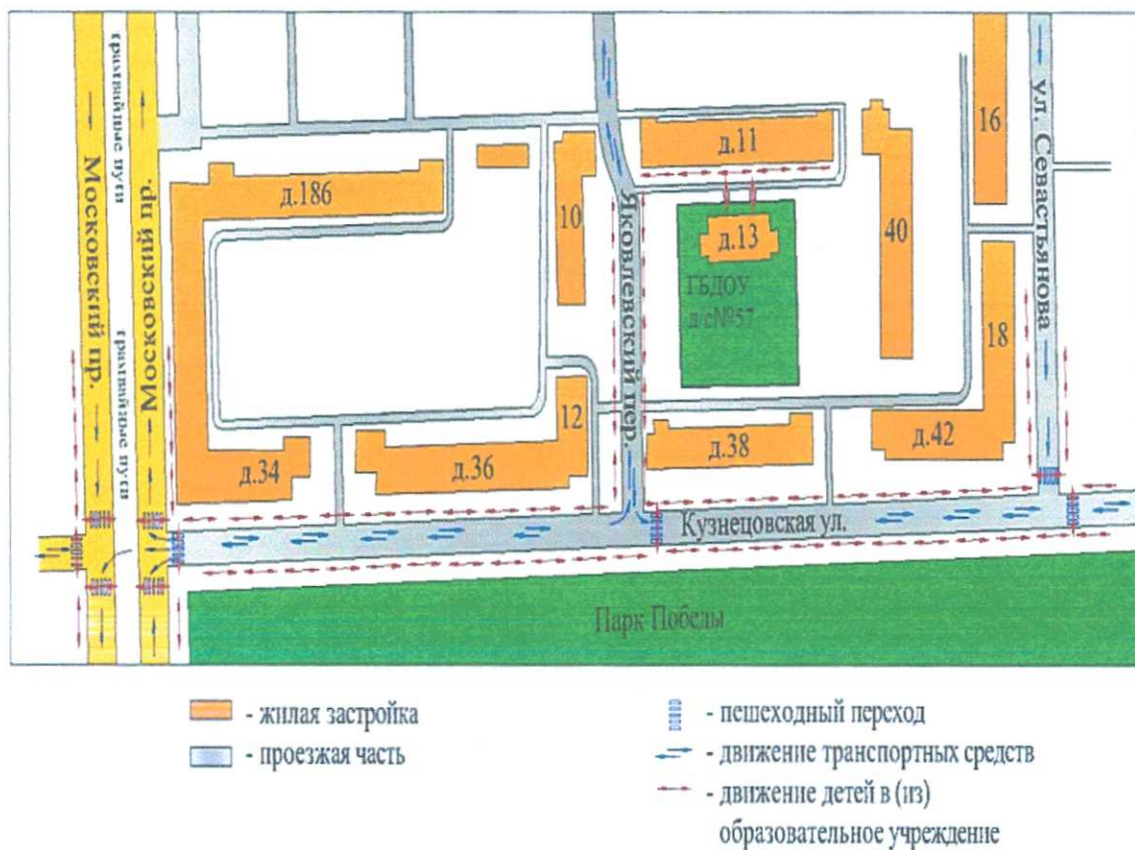
План-схема района расположения ГБДОУ д/с № 57 пути движения транспортных средств и детей.